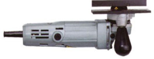
MODEL : VCF-600