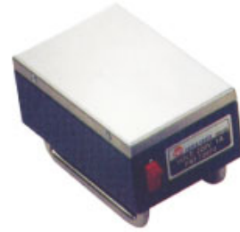
MODEL : EDH-123