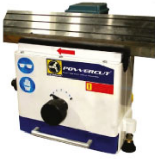
MODEL : POWER CUT PWC-400