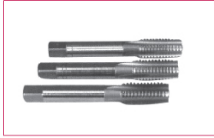
DIN 352 3'lü takım el kılavuzu HSS M3 - M24 mm arası